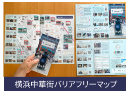
横浜中華街バリアフリーマップ

アプリを使ってバリアフリー調査を行います。収集した情報はアプリに即反映! スマホは苦手!という方には紙のマップも制作可能。